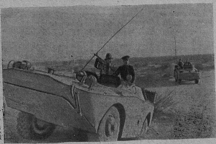
НА СНИМКЕ: на военных учениях в песках Кара-Кумов.