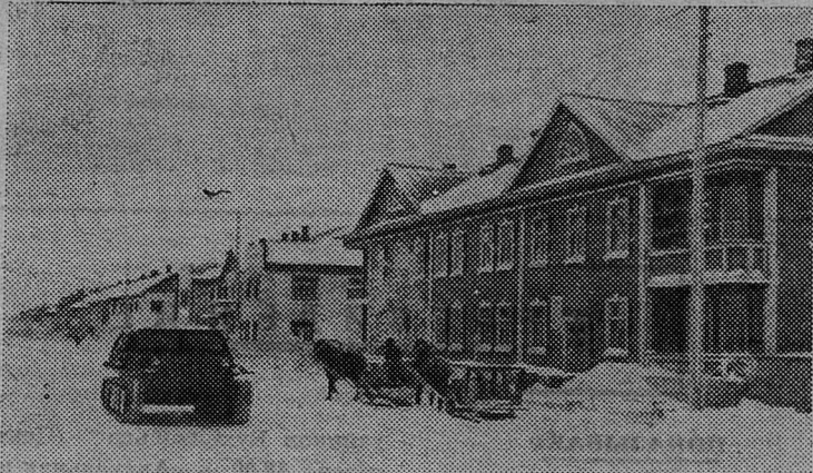
Ненецкий национальный округ. Город Нарьян-Мар.