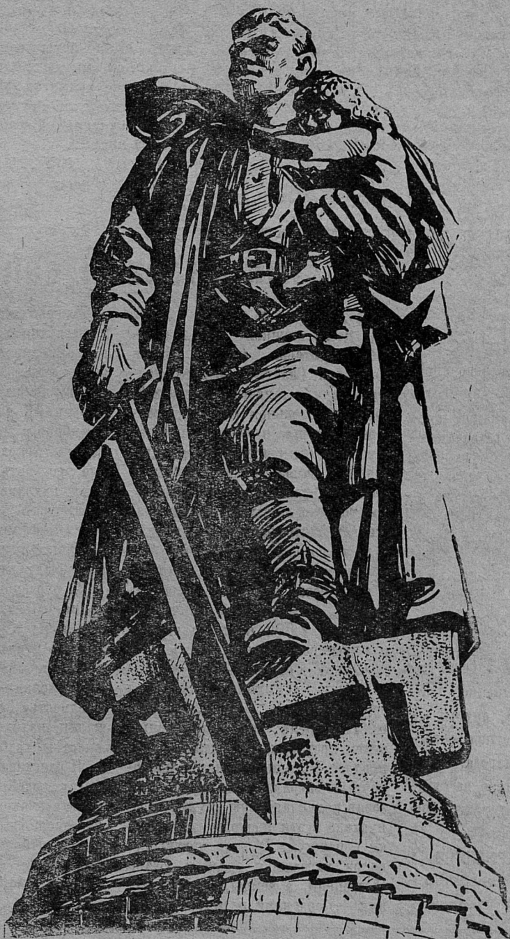
«Советский воин-победитель». Главный монумент памятника воинам Советской Армии, павшим в боях с фашизмом. Сооружен в Берлине. Скульптор Е. В. Вучетич.