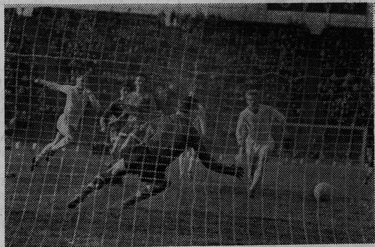
ЛЕНИНГРАД. На стадионе имени С. М. Кирова состоялся матч на кубок СССР по футболу между ленинградскими командами «Зенит» и «Динамо». Победили динамовцы — 2:1. НА СНИМКЕ: опасный момент у ворот «Динамо».

Договорные отношения и расчеты со всеми организациями по преемственности остаются за ПМК-312. АДМИНИСТРАЦИЯ.