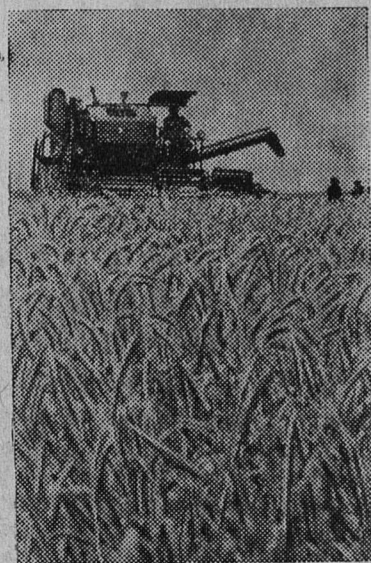
АЗЕРБАЙДЖАНСКАЯ ССР. Жатва хлебов началась в Сальянской степи.

НА СНИМКЕ: уборка урожая в совхозе имени М. Б. Касумова. Здесь посевы зерновых занимают около трех тысяч гектаров.