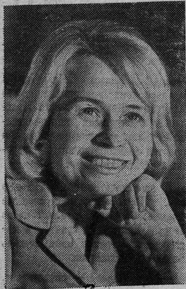
Александра Пахмутова

ведений о молодежи и для молодежи Центральный Комитет ВЛКСМ учредил ежегодные премии Ленинского комсомола. Присуждены первые 6 премий. В числе лауреатов Ленинского комсомола: писатель Николай Островский — автор бессмертных книг «Как закалялась сталь» и «Рожденные бурей», композитор Александра Пахмутова — за цикл песен о молодежи и комсомоле, ре-