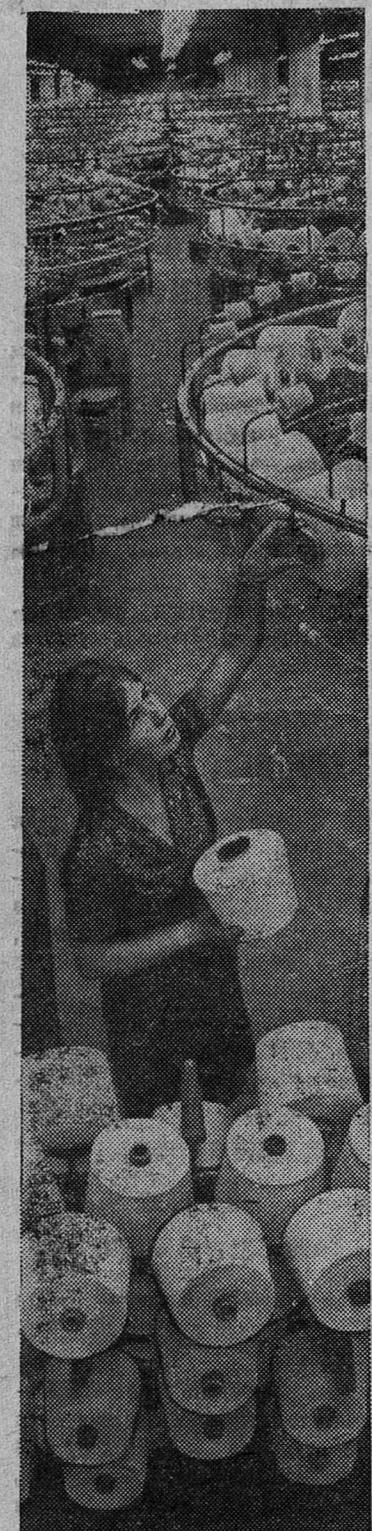
Изделия галлинской трикотажной фабрики «Марат» пользуются большим спросом. В этом году благодаря реконструкции она будет выпускать почти в полтора раза больше продукции, чем прежде.

Книга рассчитана на преподавателей, лекторов, пропагандистов-антирелигиозников и всех интересующихся научно-атеистической литературой.