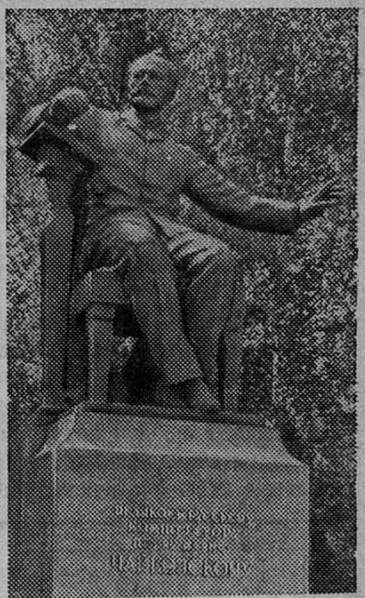
В Москве по 29 июня проходит Международный конкурс скрипачей, пианистов, виолончелистов и певцов имени П. И. Чайковского.