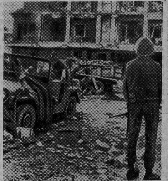
По сообщению агентства ЮПИ в Сайгоне на днях у казармы, где размещены военнослужащие США, южновьетнамские партизаны организовали взрыв. Разрушена входная часть и прилегающие помещения. Среди американских солдат имеются десятки раненых и убитых.

Бойцы Кон-Ко днем и ночью следят за врагом, полные решимости защитить каждый квадрат неба и земли дорогого отечества.