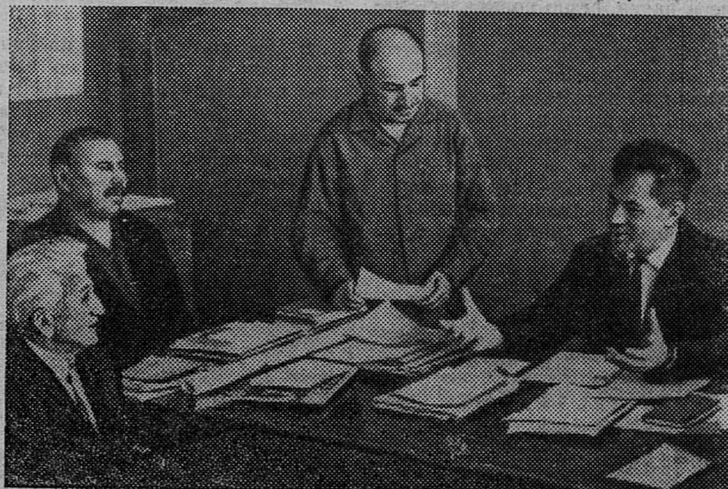
14 июля 1956 года Президиум Верховного Совета СССР принял Закон о государственных пенсиях. Это был акт величайшего значения, показывающий, какое внимание уделяет Советское государство заботе о материальном

Борьбу с вредителями и болезнями капусты и картофеля нельзя задерживать ни на один день.