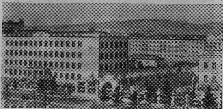
НА СНИМКЕ: новый Улан-Батор.

Не подготовили и не выставили команд кирпичный завод, лесокосомбинат, горсмешторг, автохозяйство № 123.