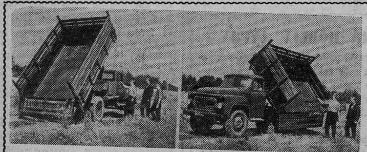
САРАНСК. ГАЗ-САЗ-53«Б» — так назван новый автосамосвал, предназначенный для нужд сельского хозяйства. Опытные образцы его изготовил Саранский завод автосамосвалов в содружестве с Горьковским автозаводом. Самосвал получил золотую медаль ВДНХ СССР.

Он может сбрасывать груз вправо, влево, назад. Его кузов пригоден для сыпучих и твердых грузов. Грузоподъемность его 3,5 тонны. Машина приспособлена для езды по всем видам дорог.