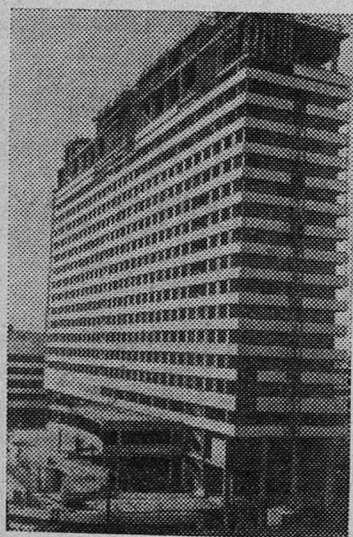
НА СНИМКЕ: 19-этажный корпус гостиницы «Советская» на Лермонтовском проспекте в Ленинграде.