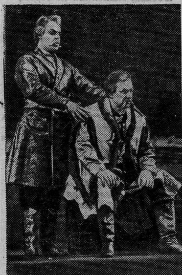
Государственный академический Большой театр Союза ССР постановил оперу П. И. Чайковского «Мазепа» по поэме А. С. Пушкина.

Как лучше укрепить здоровье ребенка? Вы, конечно, хотите, чтобы он был стройным, чтобы у него была правильная осанка. Поэтому советуем приобрести ему ранец, а не портфель, и удобную домашнюю парту.