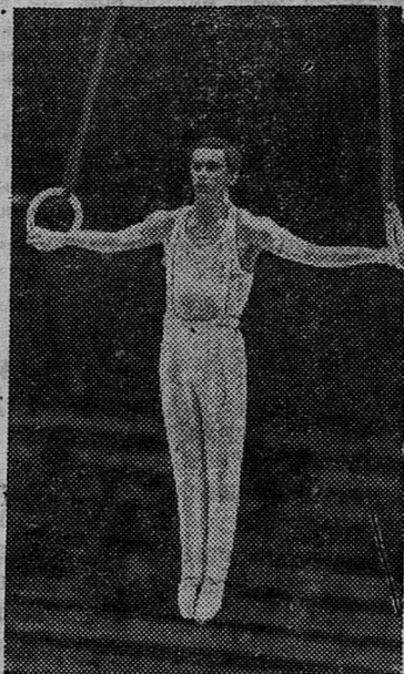
Известный советский гимнаст Михаил Воронин выполняет упражнения на кольцах.

В этом виде он занял первое место и завоевал звание чемпиона СССР. Выдающийся спортсмен, добился блестящего успеха и стал достойным преемником знаменитого «железного» Альберта Азаряна.