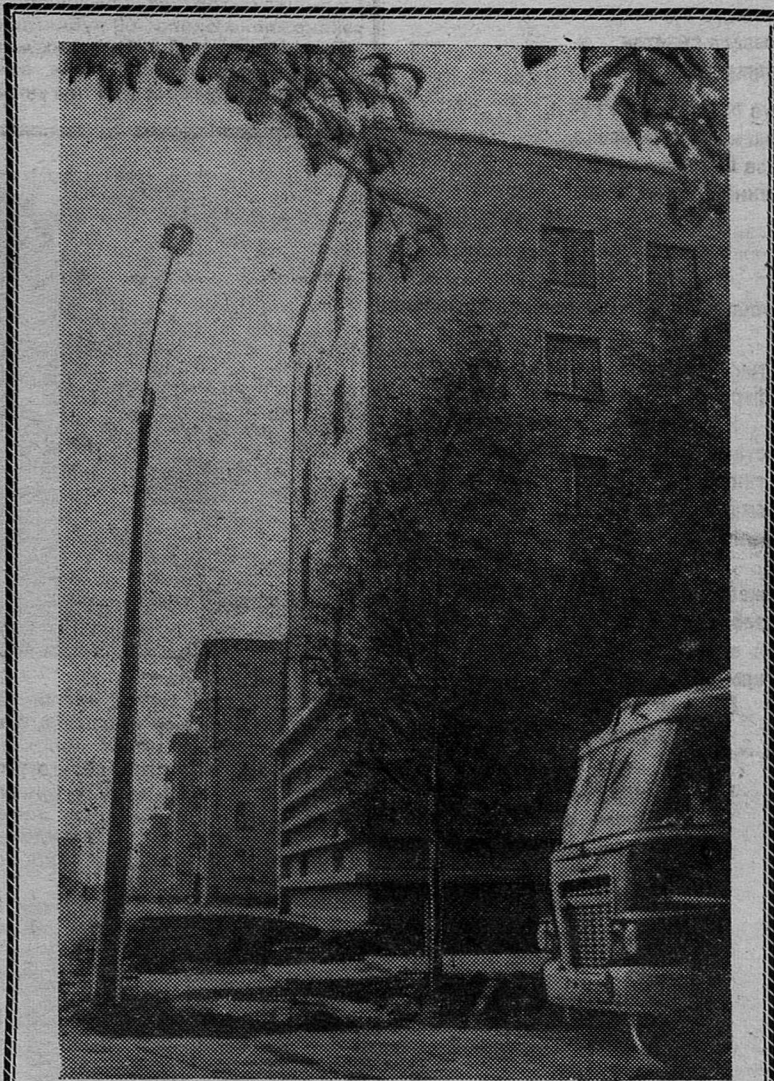
С каждым годом хорошеет и благоустраивается наш город. Вступают в строй новые жилые дома. НА СНИМКЕ: новый дом в одиннадцатом квартале.