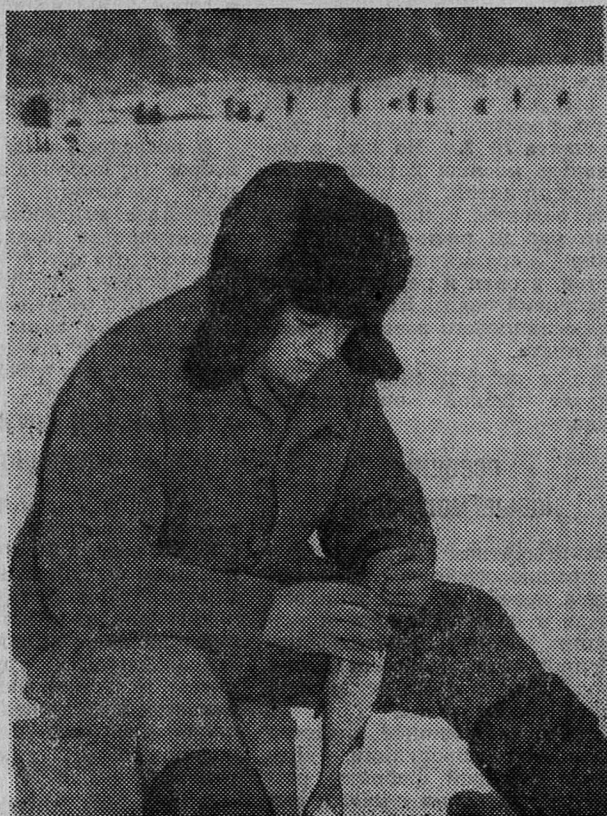
Морозным днем на реке Луге.