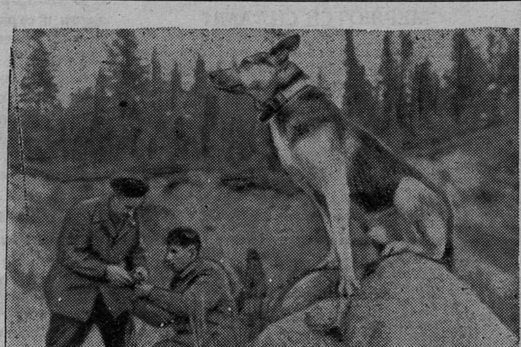
Перед вами Мурат — восточноевропейская овчарка. Скажем прямо, у него пока нет такой известности, как у английской дворняжки Шалопая, но несомненно Мурат свою славу добудет. Дело в том, что эта собака — геолог.

На учебном полигоне Петрозаводского института геологии собаку тренируют в поисках сульфидных руд. Незаурядные способности проявляет Мурат. Он легко отыскивает на поверхности рудные валуны серного и медного колчедана. Геологи решили пойти дальше и обучить Мурата поискам рудных тел, залегающих под землей.