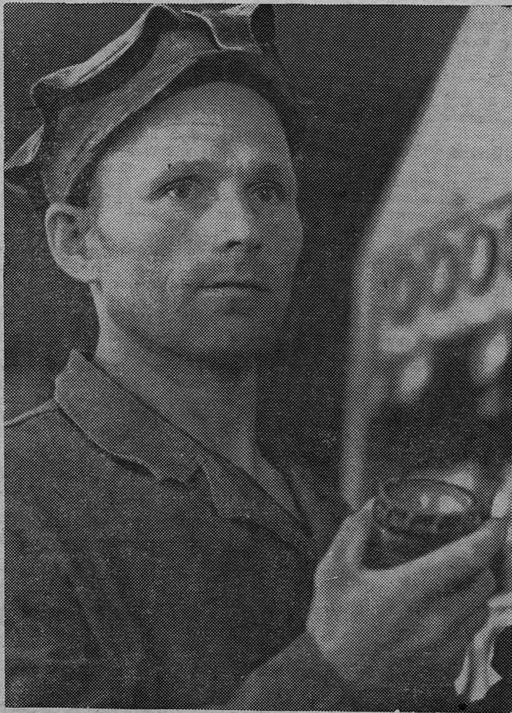
Н. И. МЕНШИКОВ