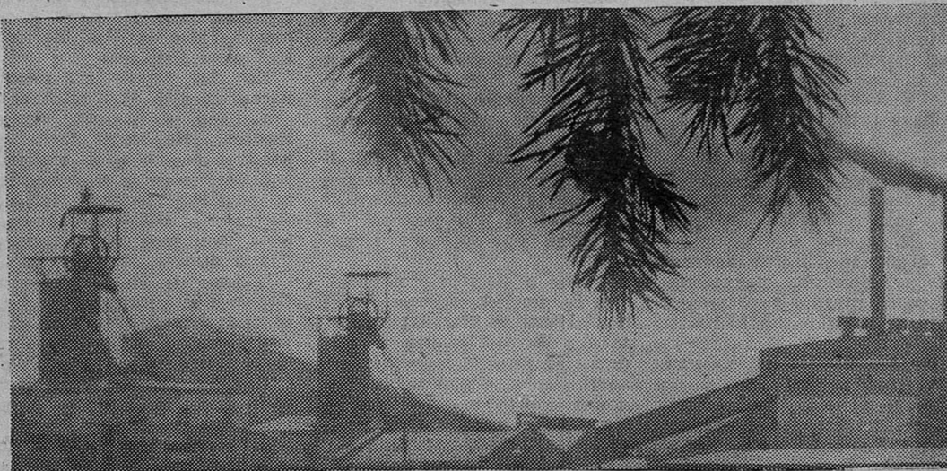
НА СНИМКЕ: вид шахты имени С. М. Кирова — старейшего предприятия в сланцевом бассейне.

Пусть огоньком веселым Звезды копров сеют свет, Всем городам шахтеры Сланцевский шлют привет. ПРИПЕВ.