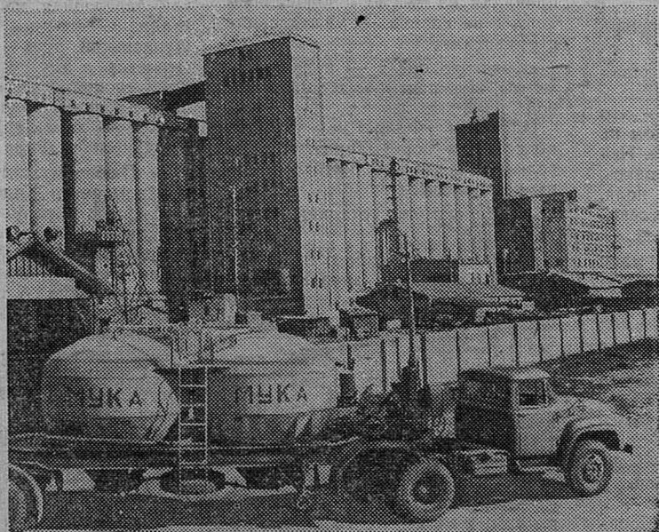
Карагандинский элеватор — один из крупных в Казахстане — ежедневно принимает зерно от 700 автомашин и 30 железнодорожных вагонов. В то же время из других ворот вывозится до 1.000 тонн муки и комбикормов.

Терапевты, педиатры, врачи других специальностей выезжают на село, консультируют больных, дают советы медработникам.