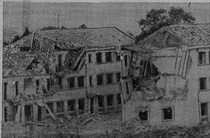
НА СНИМКЕ: вот что оставили после себя американские стервятники в городе Уонгби. В этих домах жили рабочие-электрики.