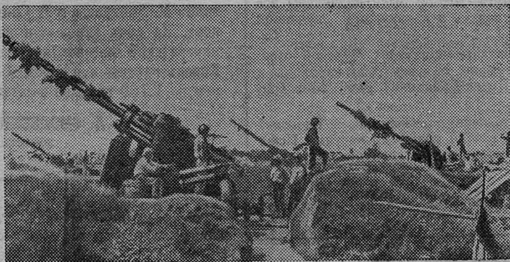
НА СНИМКЕ: зенитная батарея в окрестностях Ханоя.