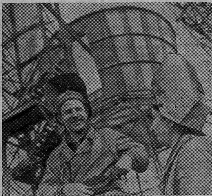
С каждым днем набирает темпы флагман нефтехимии Татарии — Казанский завод органического синтеза. Предприятие строится, вводятся новые мощности. К 50-летию Советской власти