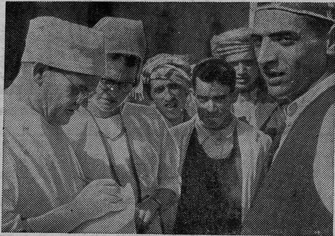
Более десяти лет работают советские медицинские работники в Йеменской Арабской Республике. Сейчас в трех городских больницах Сань, Таиза и Ходейды трудятся 20 врачей.

С далеких гор, пускаясь в многодневные переходы, идут в Сану йеменцы чтобы попасть на прием к русскому доктору. Отказа не будет.