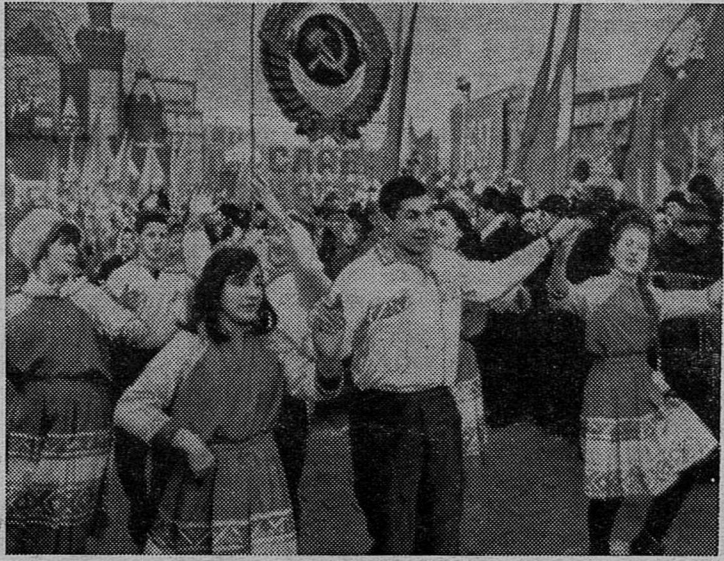
7 ноября 1966 года в Москве. Празднование 49-й годовщины Великой Октябрьской социалистической революции.

НА СНИМКАХ: сверху — демонстрация представителей трудящихся на Красной площади. Внизу — парад войск Московского гарнизона на Красной площади. Зенитные ракеты.