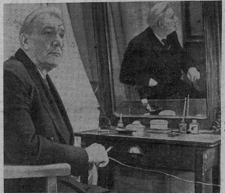
Народному артисту СССР Н. К. Симонову за исполнение роли Матиаса Клаузена в спектакле «Перед заходом солнца» и Сальери в спектакле «Маленькие трагедии» Совет Министров присвоил звание Лауреата Государственной премии РСФСР.