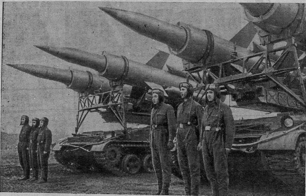
Воины-ракетчики слушают приказ командира перед маршем.