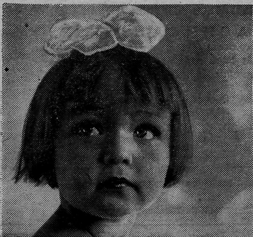
А Л Е Н К А.

Сырой картофель натирают, добавляют соль, муку, соду и перемешивают. Полученное тесто раскатывают на полоски, которые режут на кусочки длиной 2—3 см и запекают в духовке. Потом погружают в мясной бульон на 10—15 минут. Подают копытку с жареным луком и салом.