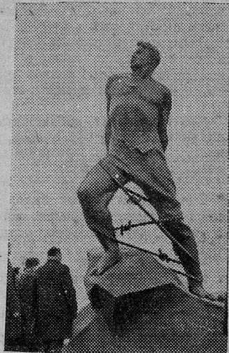
В Казани открыт памятник поэту-борцу, отважному сыну татарского народа, Герою Советского Союза Мусе Джалилю.

Авторы памятника—скульптор Владимир Цигаль и архитектор Лев Голубовский.