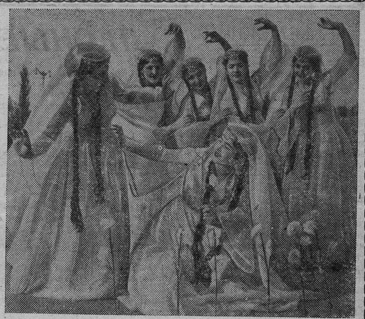
В Ереване выступает лауреат республиканских конкурсов самодеятельный народный ансамбль ереванских шинников.

художественный руководитель Дома культуры горняков.