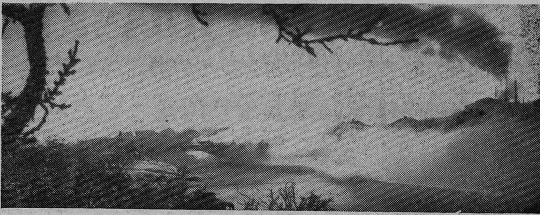
Сланцы пробуждаются.

Б. ДЕМЬЯНЮК, помощник главного инженера шахты № 3.