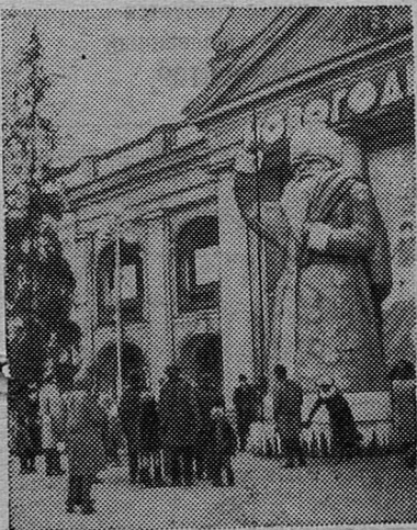
Ленинград предновогодний. На снимке: у Гостиного двора.

ВАСИЛЬЕВ, СЕМЕНОВ, УРВАНЦЕВ, ГРЕКОВ, ГОЛУБЕВА и другие жильцы дома № 6-а по улице Жуковского. Всего 19 подписей.