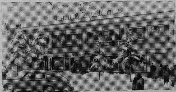
На этом снимке — новый универмаг в селе Диканька Полтавской области. Всего в этом году в селах области будет построено 53 универмага и магазина.