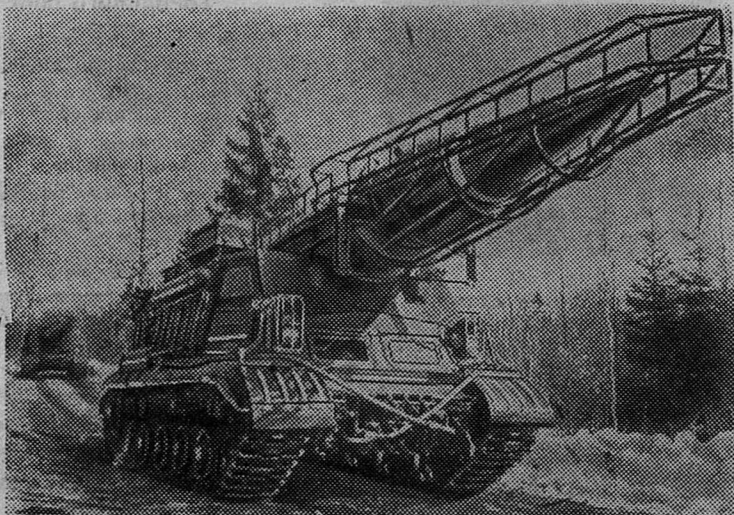
На снимке: ракетные установки на тактических занятиях.