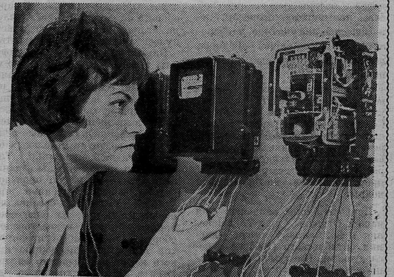
На Ленинградском электромеханическом заводе изготавливают трехфазные счетчики электрической энергии. Еще множество работников энергетических хозяйств занято записью их показаний. На заводе решили создать счетчики с телемеханическими датчиками, которые будут передавать показания на расстоянии по проводам. Поставленную задачу коллектив предприятия высокой культуры решил успешно. Новый электроизмерительный прибор индукционной системы успешно прошел испытания. Теперь показания расхода электрической энергии будут передаваться на пульт оператора или диспетчера.

Л. ТИХОНОВА, работница цеха КИП и автоматики сланцеперерабатывающего комбината «Сланцы».