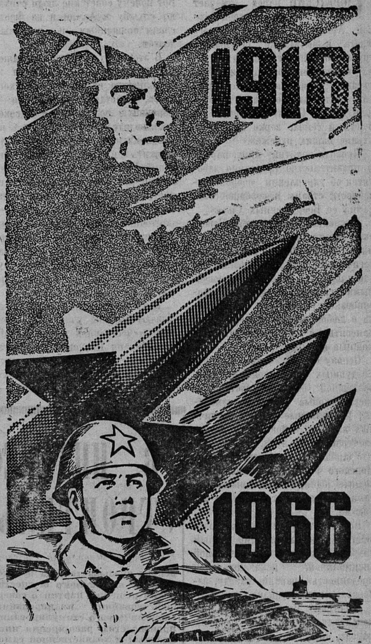
Плакат художника И. Полярного.

Сегодня — День Советской Армии и Военно-Морского Флота СССР