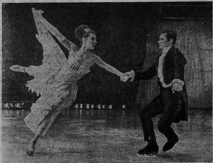
В Москве проходит фестиваль искусств «Русская зима». В первый день фестиваля в Государственном цирке была показана разнообразная программа в исполнении Государственного ансамбля «Цирк на льду».

АДРЕС РЕДАКЦИИ: гор. Сланцы, ул. Банковская, дом № 3. ТЕЛЕФОНЫ: редактора — 23-20, зам. редактора и отв. секретаря — 23-25, отделов промышленности — 23-23, писем и массовой работы — 23-66, сельского хозяйства — 21-85, директора типографии — 23-14. Объявления принимаются в бухгалтерии редакции.