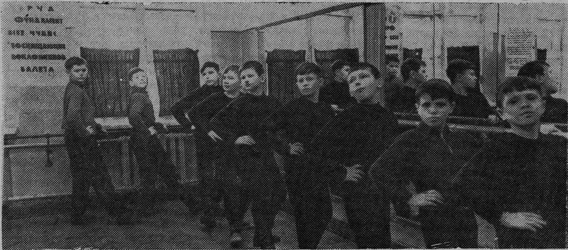
При Доме культуры горняков создана танцевальная группа мальчиков. С большой теплотой встречают ее выступления сланцевчане. Но для того, чтобы хорошо и легко танцевать, приходится много репетировать.

секретарь партийной организации совхоза «Родина».