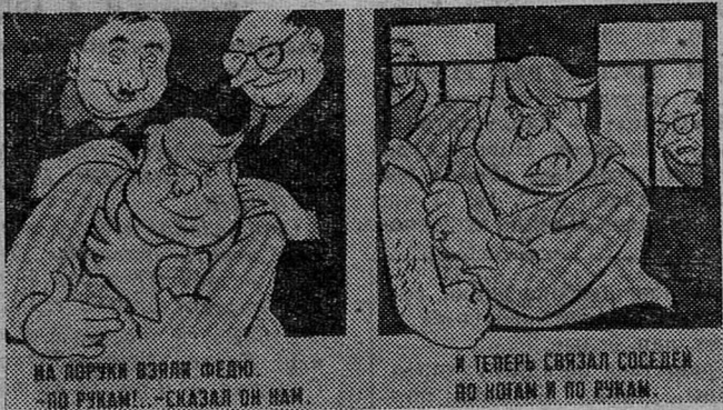
НА ПОРУКИ Взяли Федю. — По рукам! — сказал он нам.