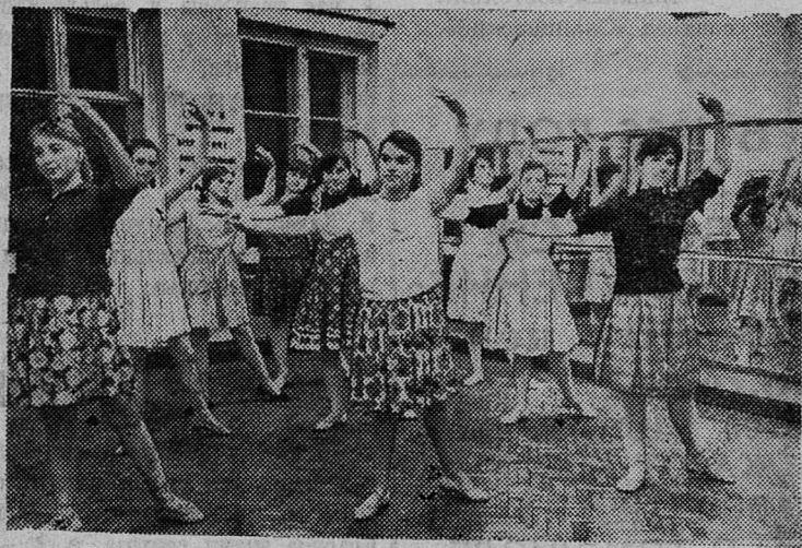
Несколько месяцев прошло с тех пор, как при Доме культуры горняков была создана танцевальная группа. В ней 14 девушек. Сейчас они совместно с мужской группой танцевального коллектива готовят русский народный танец. НА СНИМКЕ: танцевальная группа на репетиции.