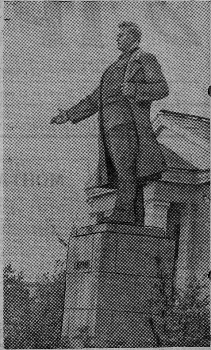
На снимке: памятник С. М. Кирову в Сланцах.