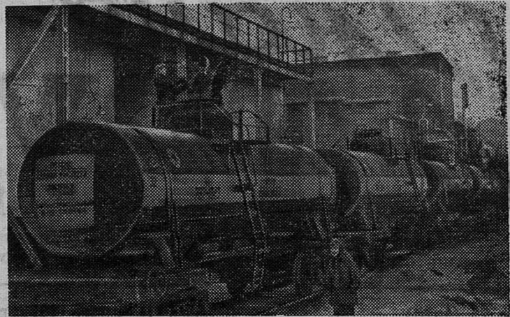
БЕЛОРУССКАЯ ССР. По пятилетнему плану развития народного хозяйства СССР на 1966—1970 годы предусмотрено завершение строительства Гомельского суперфосфатного завода. Недавно здесь вступил в строй цех серной кислоты. Первые тонны продукции отправлены минским тракторозаводом, Новополоцкому нефтеперерабатывающему заводу, химикам Украины.