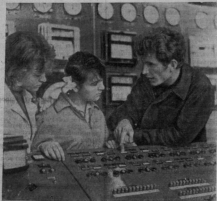
150 молодых химиков — будущих аппаратчиков Вахского азототукового завода, что сооружается на юге Таджикской ССР, — проходили производственную практику в Узбекистане,

В принятом постановлении намечены конкретные мероприятия по широкой мелиорации и повышению плодородия совхозных земель.