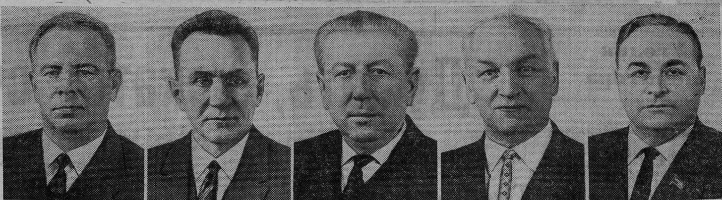
Н. В. ПОДГОРНЫЙ