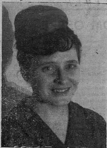
Мечта! Какое это волнующее, заманчивое слово. Постучится в