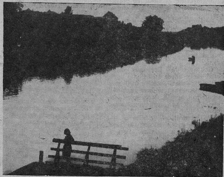
На реке Плюссе.

✳ НА РАЗЛИЧНЫЙ ВОЗРАСТ ✳ НА ЛЮБОЙ ВКУС ✳ НА РАЗНЫЕ ЗАПРОСЫ