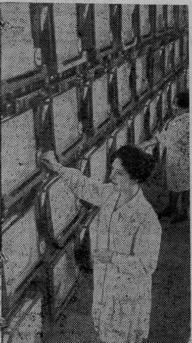
Тысяча телевизоров «Сигнал-2» сходит ежедневно с конвейера Ленинградского завода имени Козицкого.