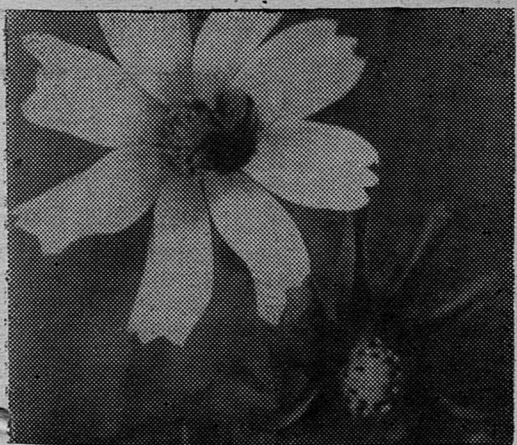
Ц В Е Т Ы.