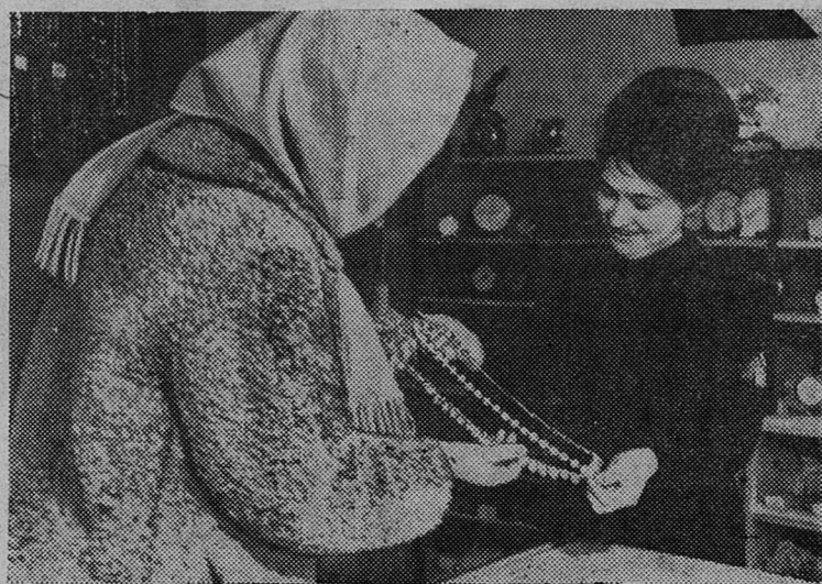
Недавно в нашем городе открылся новый магазин «Ландыш». За прилавками — молодые продавцы. Почти все они комсомолы. Комсомольско-молодежный коллектив магазина борется за отличное обслуживание покупателей.

— В магазине с хорошим обслуживанием, — говорят покупатели, — приятно и заходить.