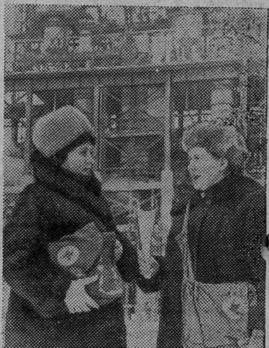
На Щекинском химкомбинате имеется своя поликлиника, которая обслуживает работников предприятия. Врачи и медсестры поликлиники частые гости в его цехах. Они следят за санитарным состоянием производственных помещений, ведут работу в санитарных дружинах.

4. Снизить себестоимость продукции против плана на 250 тысяч рублей.