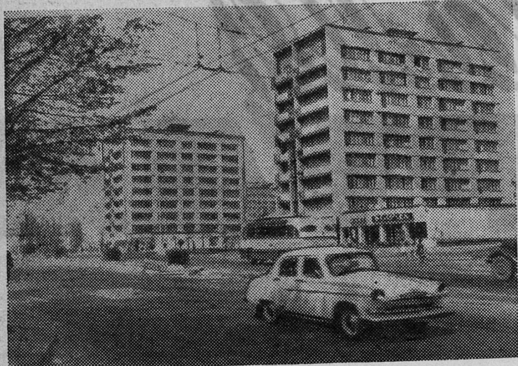
МИНСК. Новые девятиэтажные жилые дома на Могилевском шоссе.