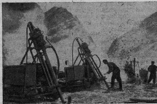
Высоко в горах Таджикистана трудятся строители высокогорной Нурекской ГЭС. На днях они сдали в эксплуатацию второй тоннель длиной 1.625 метров. Новая гигантская подземная магистраль проложена сквозь Сандук-гору рядом с первой, действующей уже больше года. Оба подземных русла способны пропускать до 3.200 кубо-