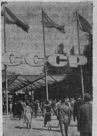
Фото В. Мاستюкова.

НА СНИМКЕ: посетители направляются на выставку.