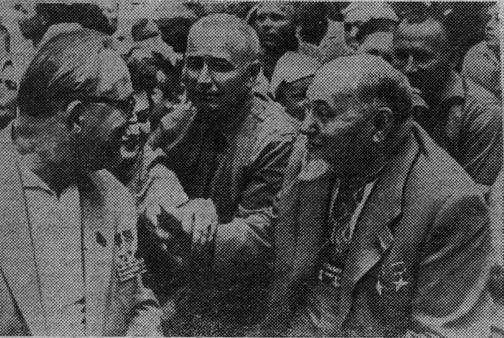
Сегодня исполняется 80 лет со дня рождения (1887) дважды Героя Советского Союза Сидора Артемовича Ковпака, советского государственного деятеля, одного из организаторов партизанского движения на Украине в гражданскую и в Великую Отечественную войны.

Выписывайте и читайте журналы по сельскому хозяйству. «Союзпечать».