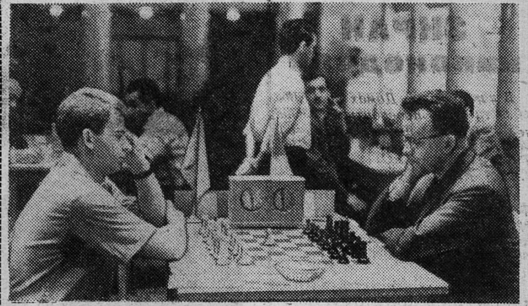
В Центральном Доме Советской Армии проходит международный шахматный турнир 18 гроссмейстеров, посвященный 50-летию Великой Октябрьской социалистической революции. НА СНИМКЕ: за игрой (слева) Б. Спасский (СССР) и Л. Пахман (Чехословакия).

Важную роль в устранении причин возникновения лесных пожа-