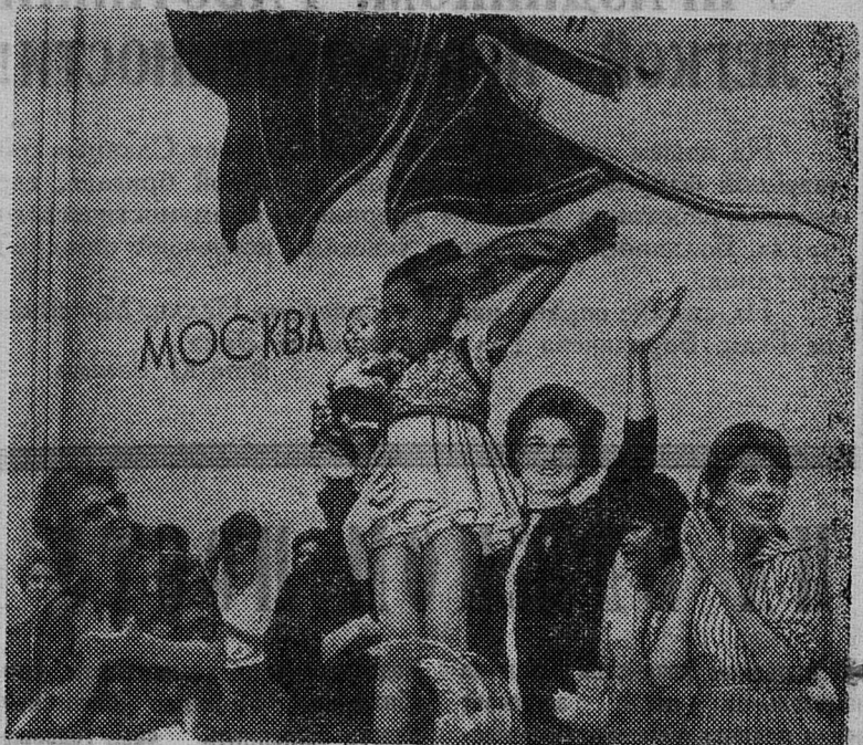
В. Соболев. «Пусть всегда будет солнце!».