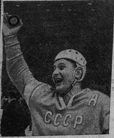
В. Шандрин. «Вот она, золотая шайба!». (В. Александров).