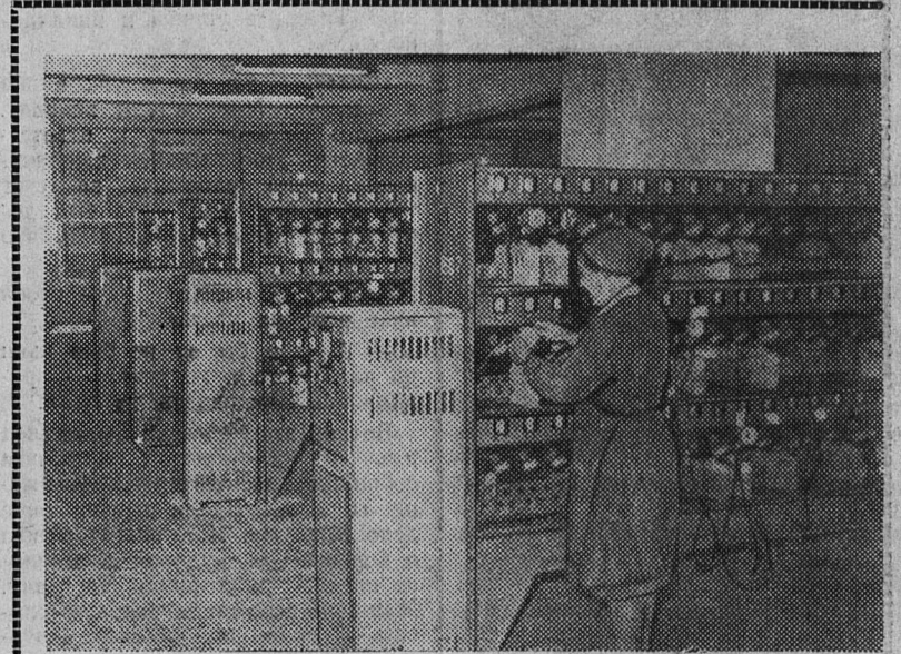
Работники аккумуляторной лампы шахты № 1 борются за звание коллектива коммунистического труда.

Все эти объекты запланировано сдать в нынешнем году. В. ПЕТРОВ.