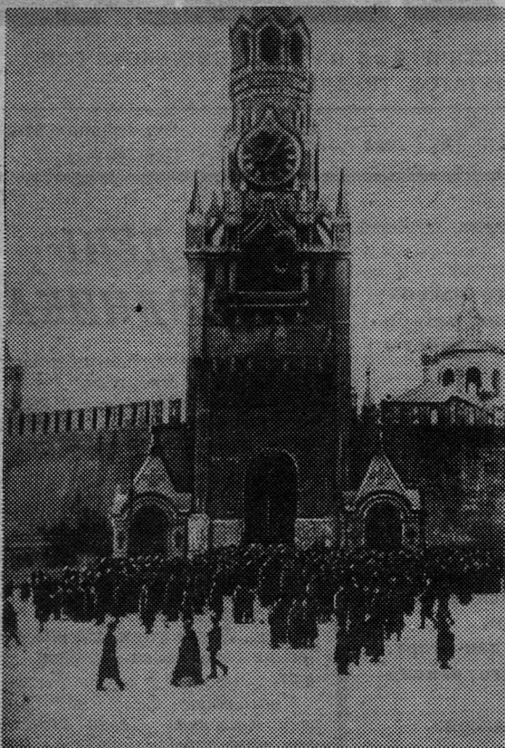
Москва, ноябрь 1917 года. Кремлевские куранты со следами повреждений после обстрела в дни октябрьских боев 1917 года.

На вечернем заседании обсуждался вопрос об организации рабочей молодежи. Съезд заслушал